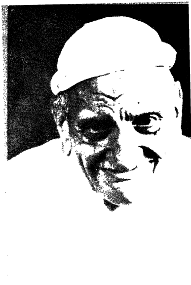
अखिलेश्वर प्र. साहय चन्द्र जीत (संस्था)